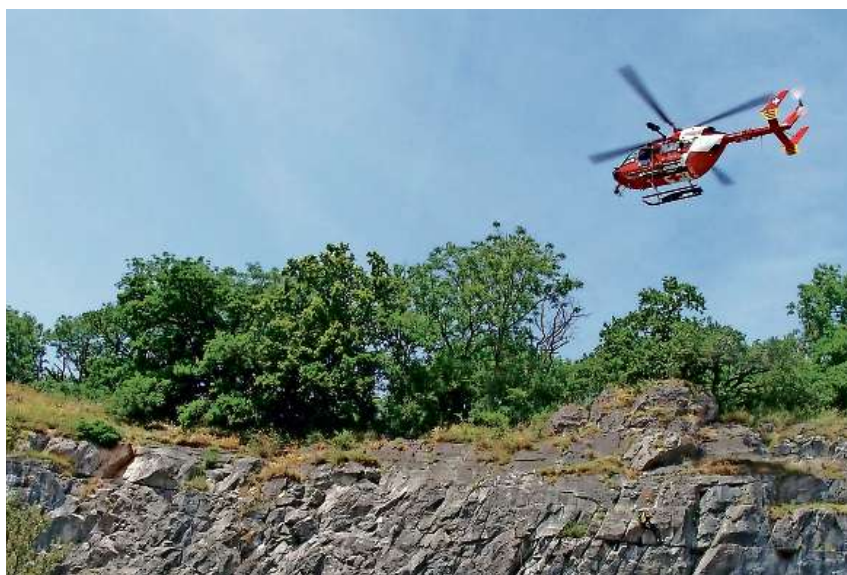
Könnte vermieden werden: Eine Wanderung, die im Rettungshelikopter endet.

Es gibt aber durchaus weit dramatischere Fälle. Schon bis zur Jahreshälfte haben sich fünf tödliche Unfälle in der Ostschweiz ereignet – und das, bevor die eigentliche Wanderzeit während der Sommermonate begann.